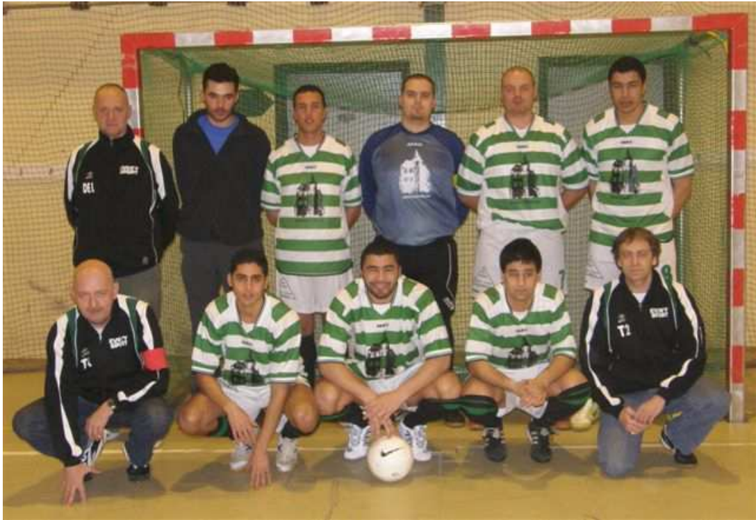
LA TOURELLE Champion de 3e Provinciale D