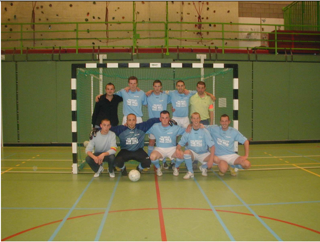
THE HILL BRAINE Champion de 4e Provinciale C et Vainqueur de la Coupe Seniors b