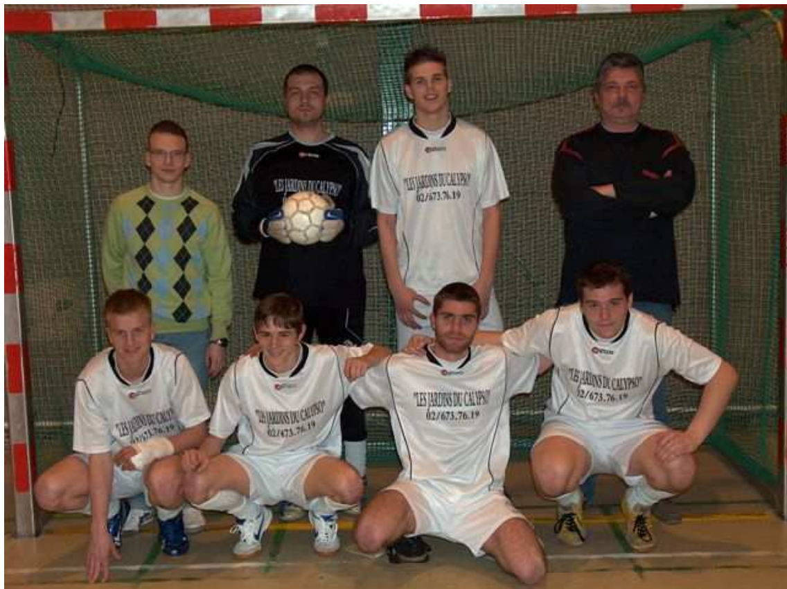
CFS 3 TILLEULS b Champion de 3e Provinciale E