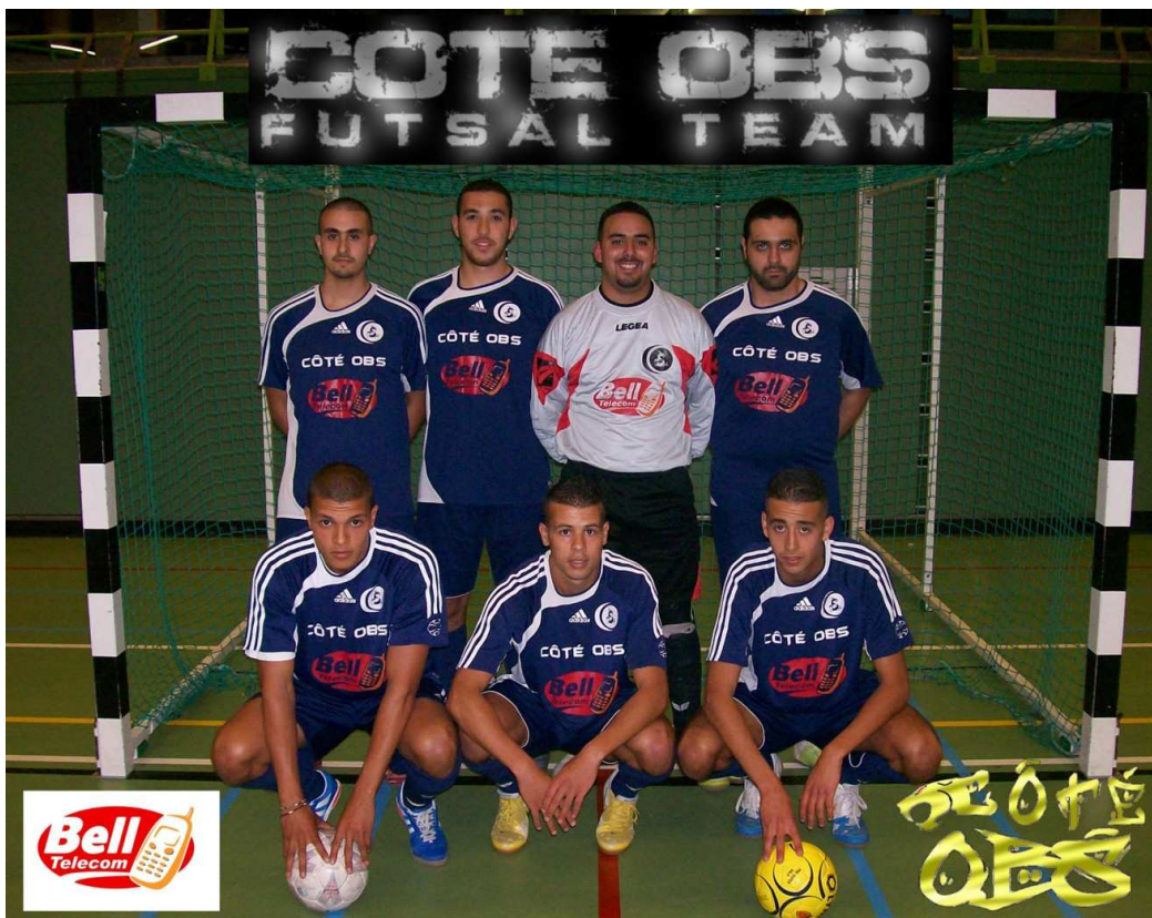
COTE OBS Champion de 3e Provinciale B