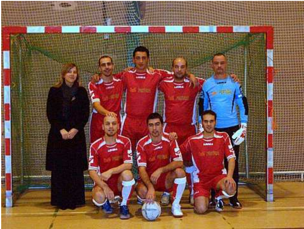
RED BOYS Champion de 5 e Provinciale L