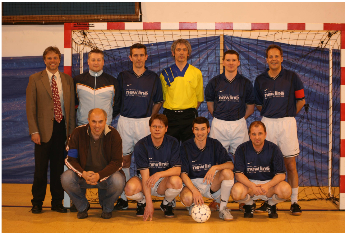
JETTE 40 Champion en Vétérans 2A