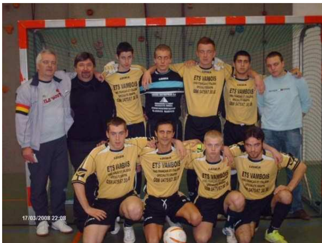
PTIT BXL REBECQ Champion de 4e Provinciale B