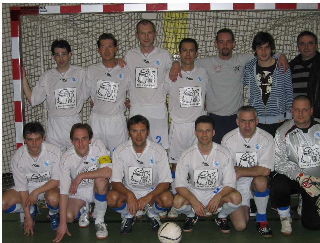
C. S. MARINERS Champion en Vétérans 2B