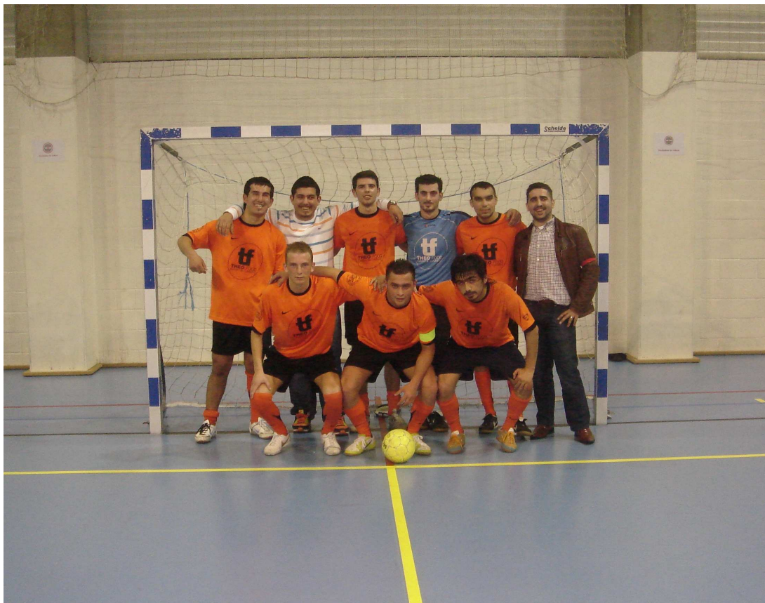
BESIKTAS Champion de 4e Provinciale D