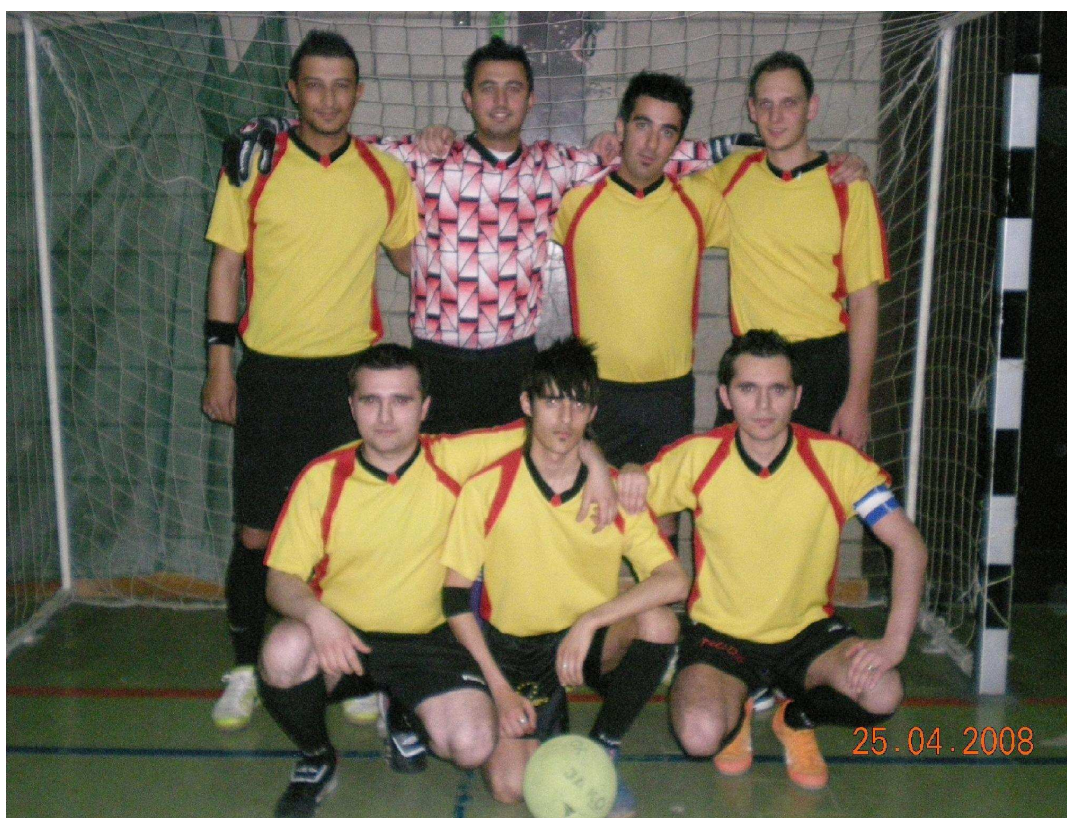
CIMBOM BRUXELLES Champion de 5 e Provinciale C