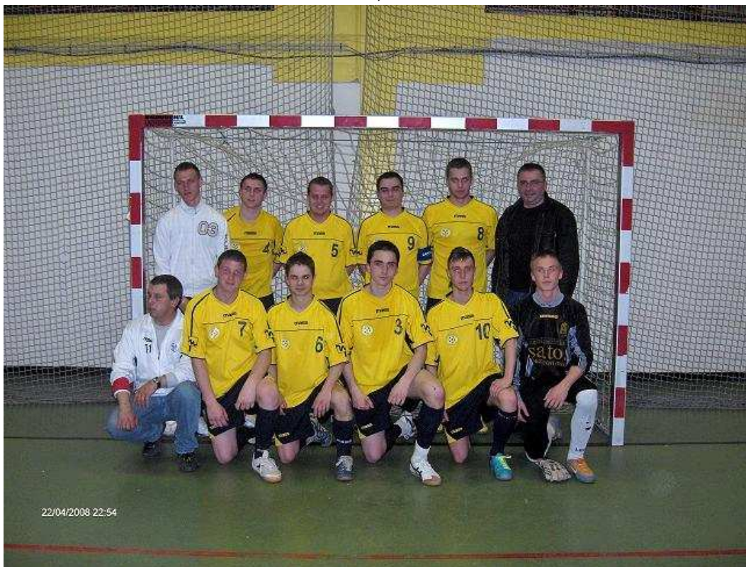
C. S. MARINERS d Champion de 4e Provinciale H