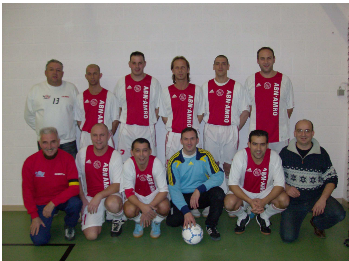
AJAX REBECS b Champion de 5e Provinciale B