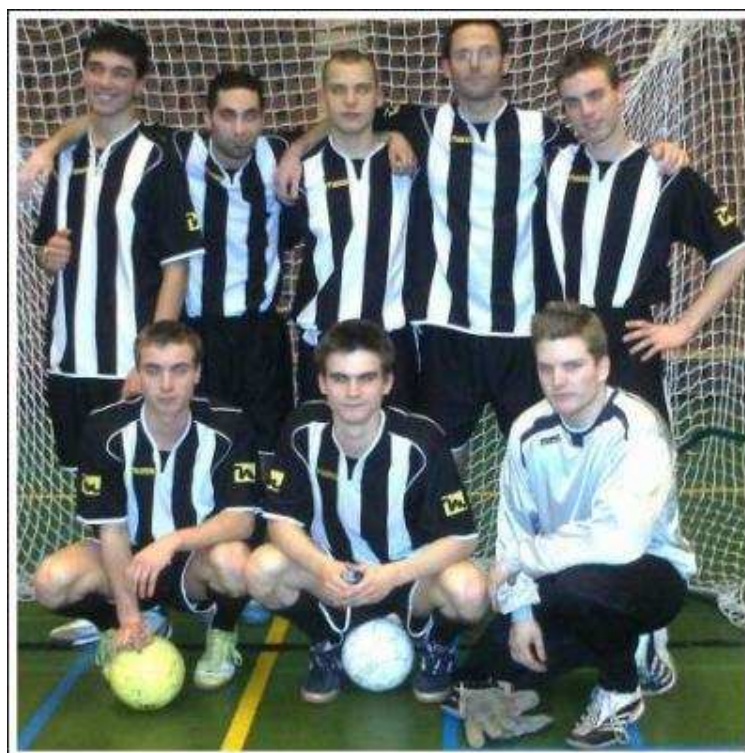
HTB UNITED Champion de 5 e Provinciale K