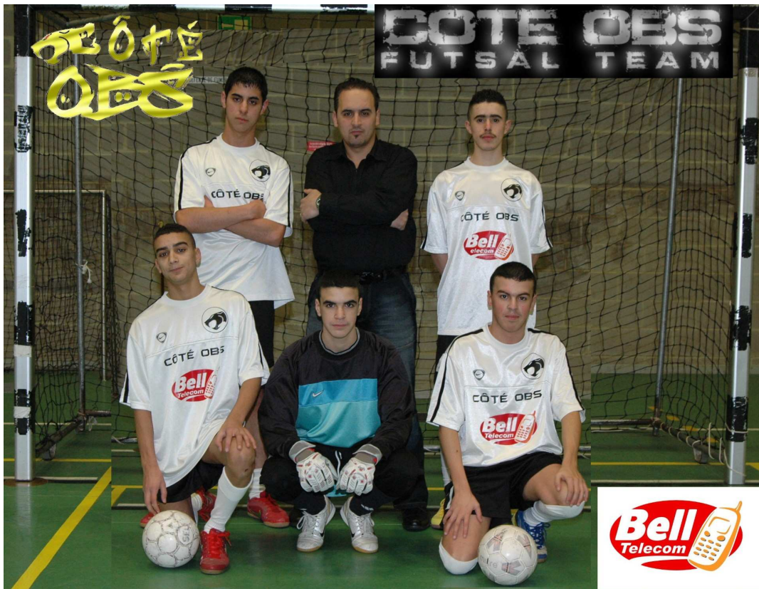
COTE OBS b Champion de 5 e Provinciale E