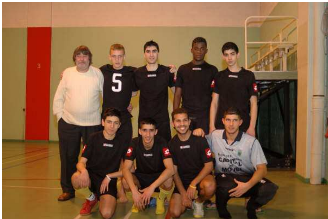
AVENIR 1060 Champion de 2e Provinciale B