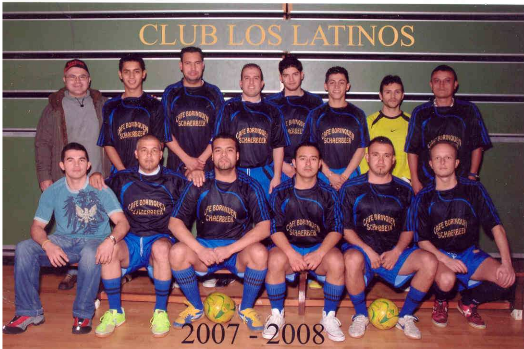
LOS LATINOS Champion de 4e Provinciale G