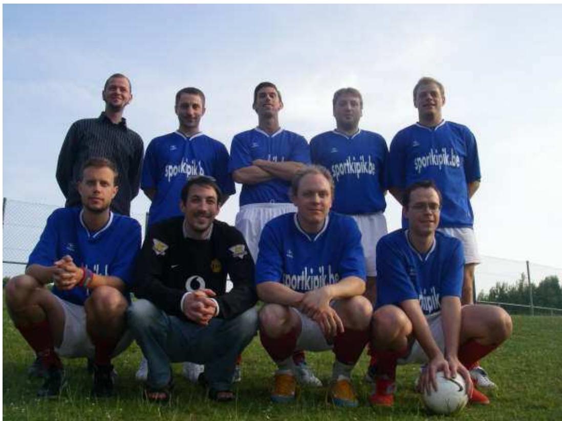
FC BOROVICKA b Champion de 5 e Provinciale M