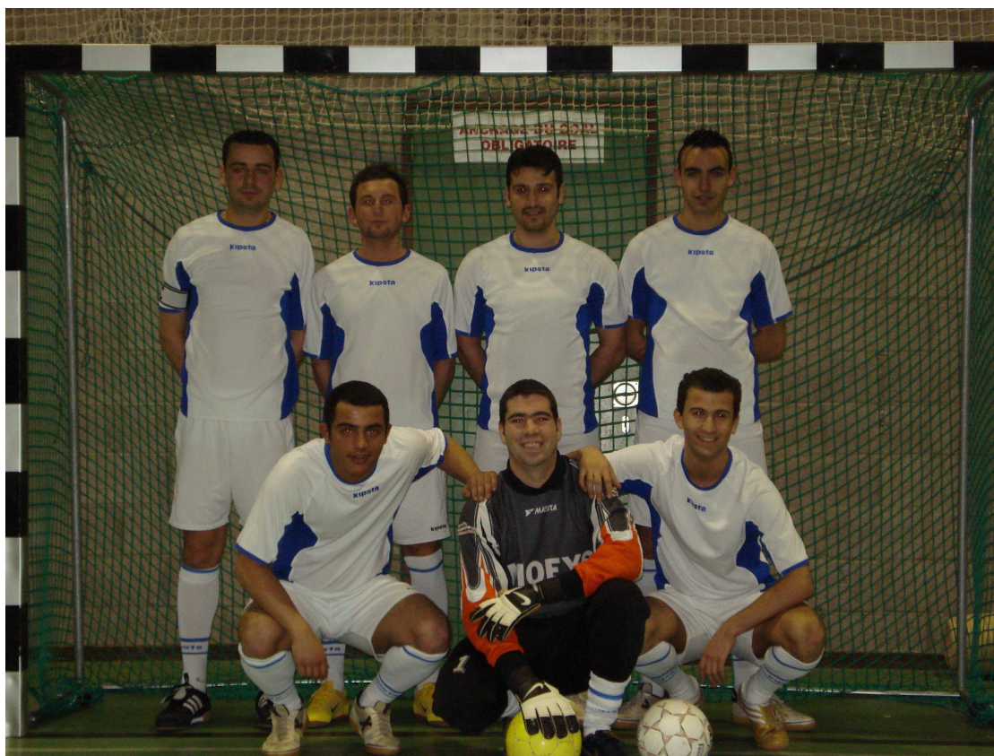
FS VICTOIRE Champion de 5 e Provinciale H