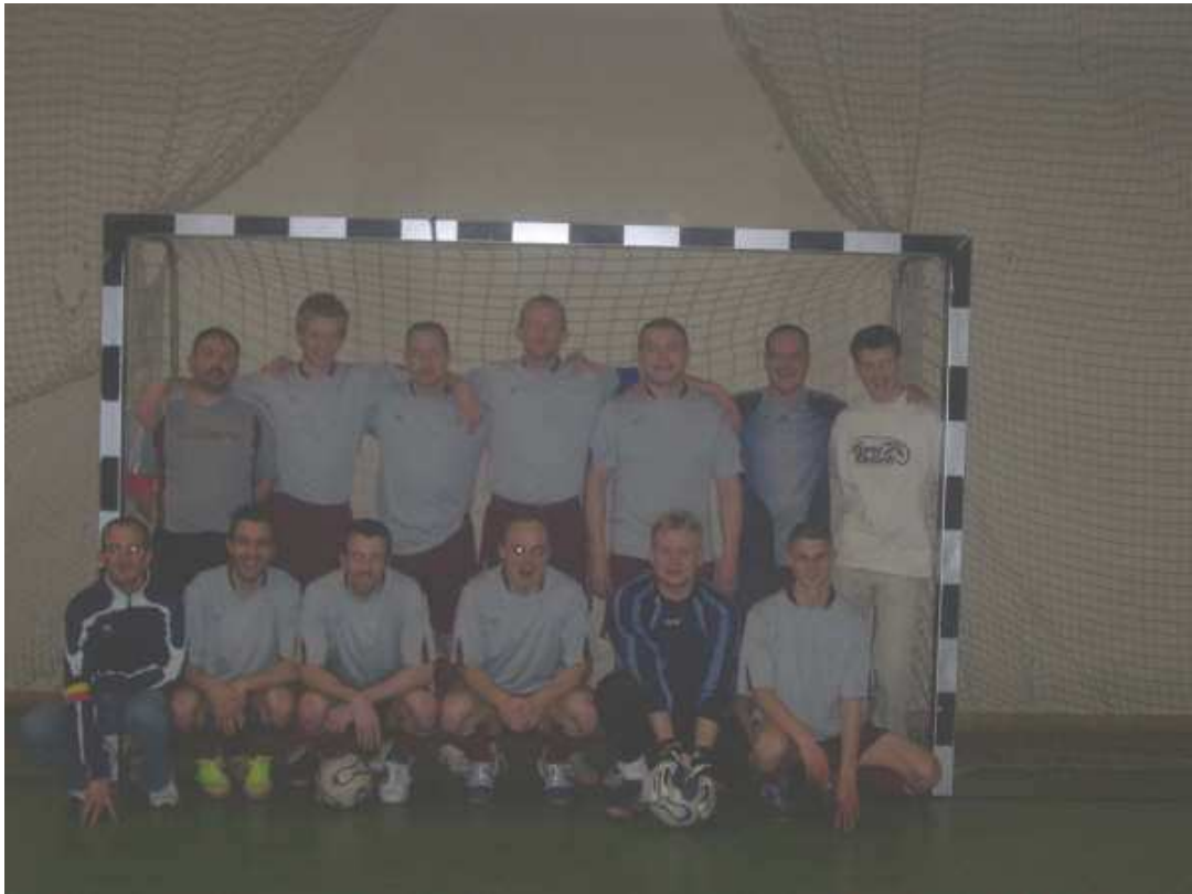
MFC BABYLONE Champion de 2e Provinciale A