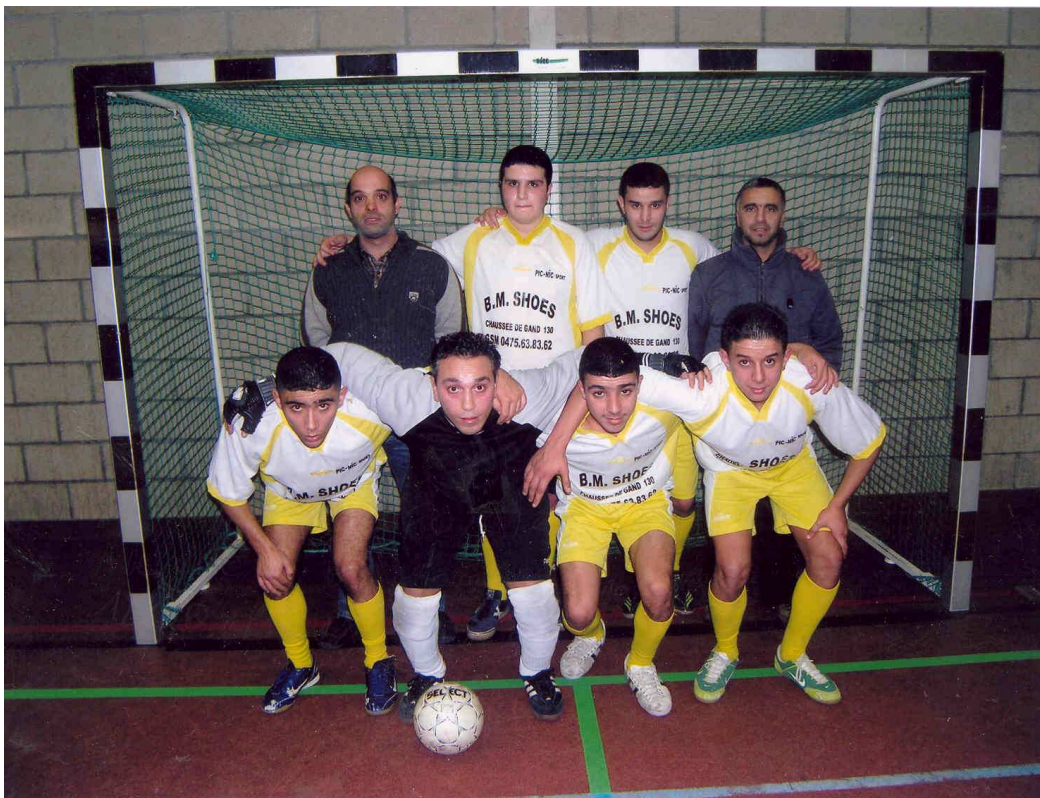
PN MOLENBEEK b Champion de 5 e Provinciale F