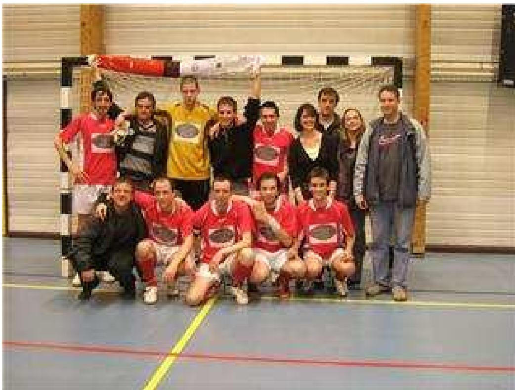
WILD DUCKS Champion de 4e Provinciale A